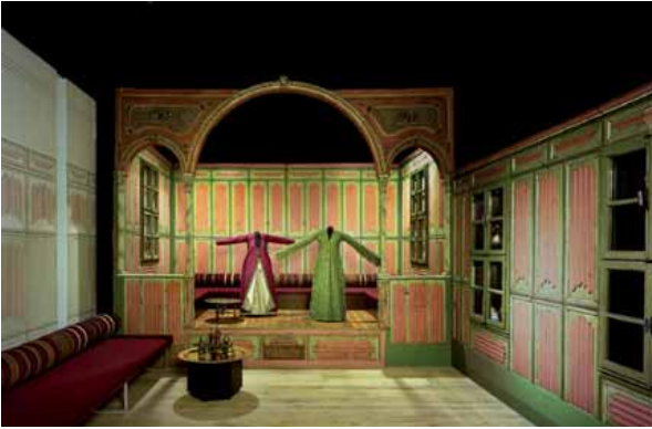
Rautenstrauch-Jost-Museum: Raumbild „Lebensräume – Lebensformen: Türkei – Der Empfang von Gästen“