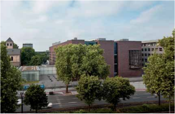
Das neue Rautenstrauch-Joest-Museum – Kulturen der Welt, mit Erweiterungsbau Museum Schnütgen – Kunst des Mittelalters