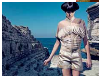
Istanbul Fashion © Arzu Kaprol / Tamer Yilmaz